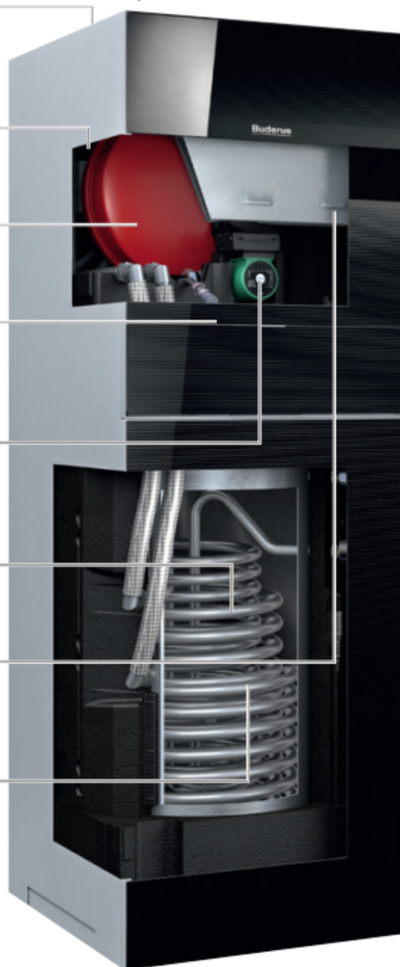
Moduł wewnętrzny „Tower”

do ogrzewania c.w.u. dodatkowym źródłem ciepła.